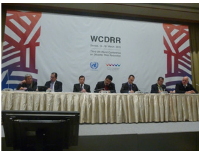
Reunión Convocada por CEPREDENAC Sendai Japón 2015