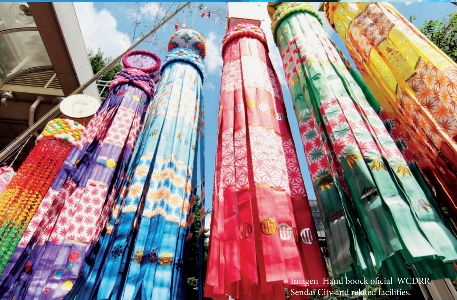
Imagen Hand boock oficial WCDRR Sendai City and related facilities.