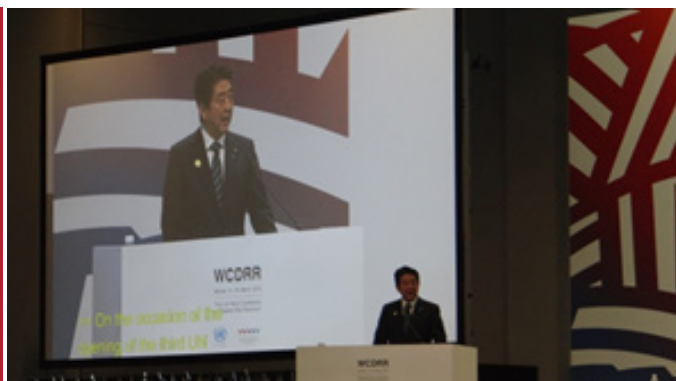
Primer Ministro de Japón, Sr. Shinzo Abe

“...El objetivo de Japón no es solo reconstruir, sino reconstruir con mejores bases...aprovechar la cultura del pueblo japonés para mejorar la percepción constante del riesgo y proteger a la población de manera integral...”