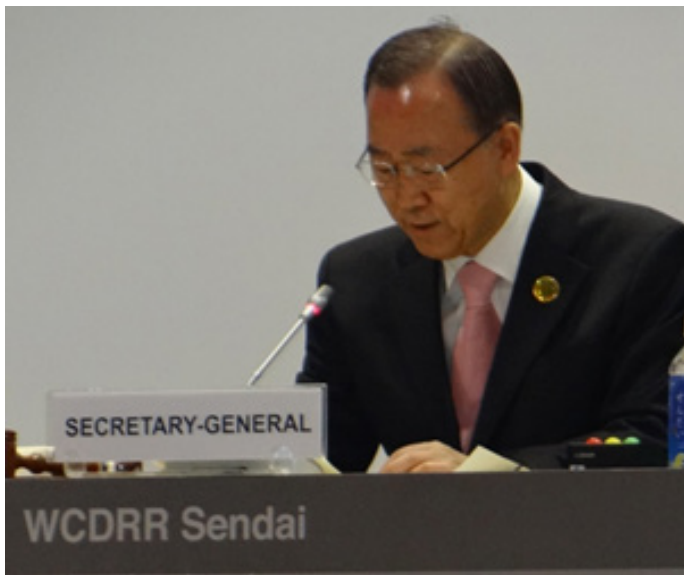
Ban Ki-moon Secretario General de las Naciones Unidas Sendai Japón 2015.

“El camino a la sostenibilidad inicia aquí, en esta ciudad con ocasión de la III conferencia, ya que de aquí vamos a la Cumbre Mundial de Sostenibilidad y la Cumbre Mundial de Cambio Climático, todas en el 2015...el objetivo la construcción de una agenda articulada entre estos temas para tener una agenda pos 2015 de carácter integral...ya que 9 de cada 10 afectados por los desastres so personas que viven en países de bajos y medios ingresos...el mundo es cada día más pequeño, un terremoto en una zona lejana ocasiona sismos financieros en otra, una tormenta provoca turbulencias en la economía...tenemos pérdidas por 6,000 millones anuales, que debemos evitar para garantizar la sostenibilidad...”